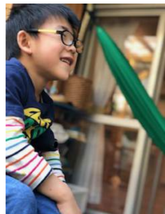
テラスでシャボン玉