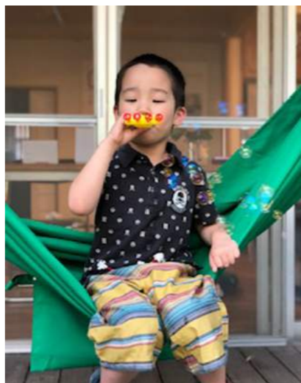
みんなハンモック大好き♡