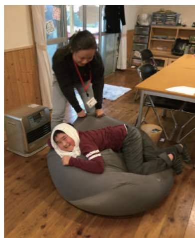
外で遊んで顔が真っ赤 冷やしながら遊んでます♪