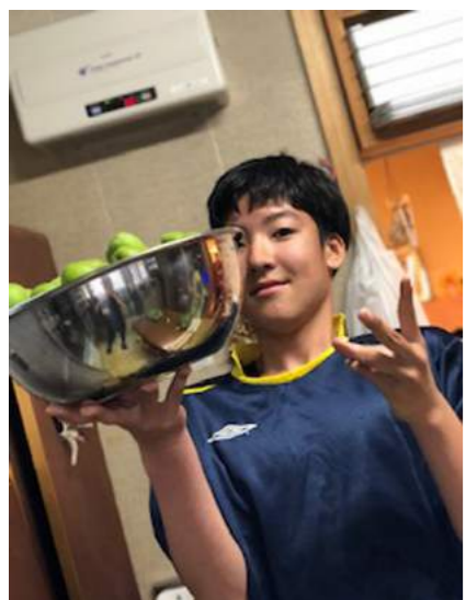
梅をいっぱい収穫したよ!