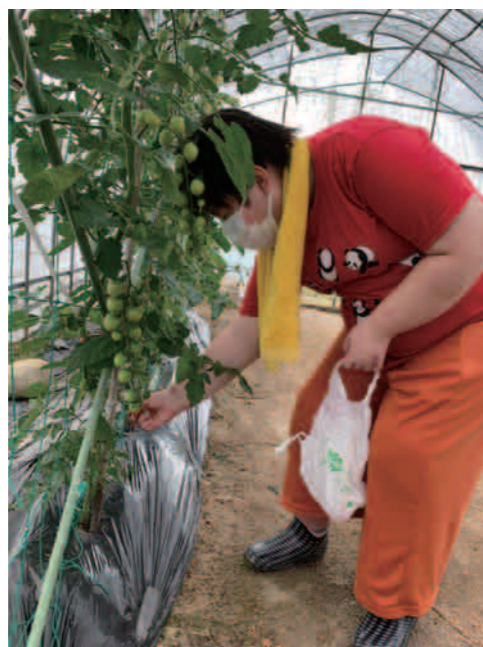
今夜の晩ご飯 何にしようかなあ