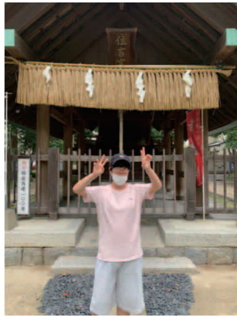
ゆきちゃんになった気分!!