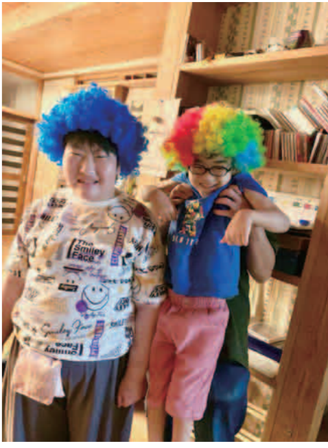
アフロも似合うでしょ?