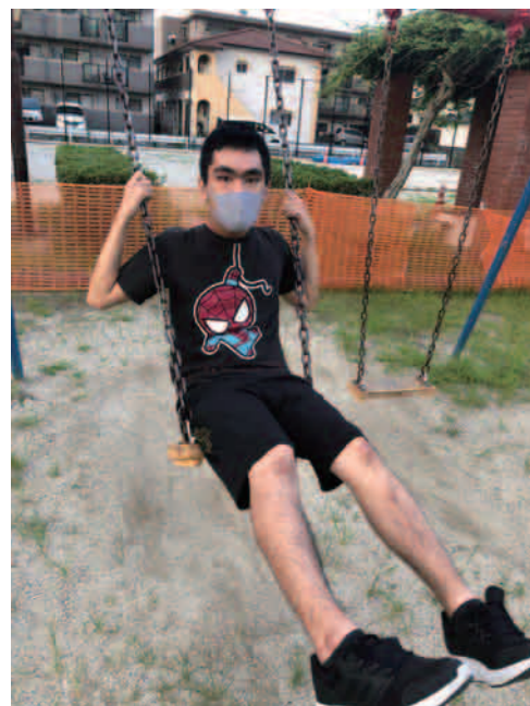
ハイジになった気分!!