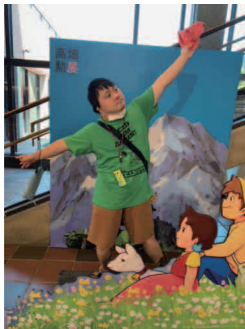
ペーターになった気分!!