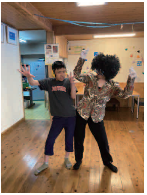
初めてとは思えない先生とのペアダンス