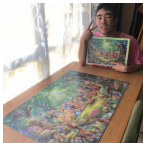
ジグソーパズルの天才です!!