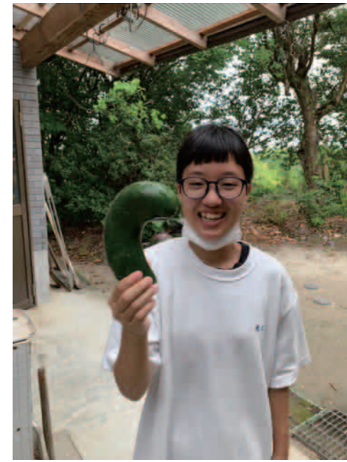
巨大キュウリすごいでしょ?!