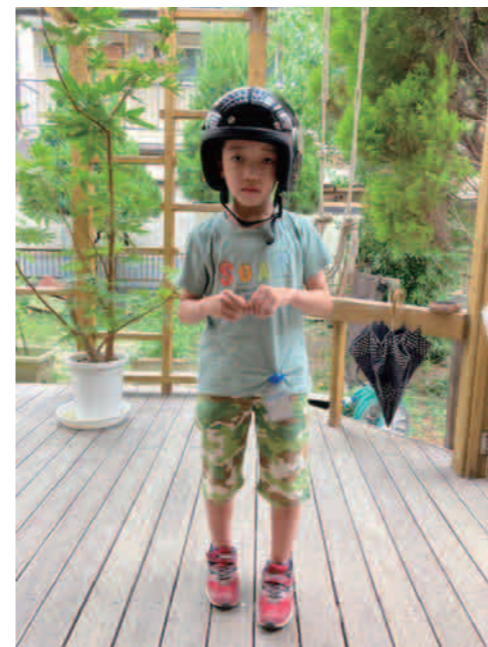
ヘルメット似合うでしょ?