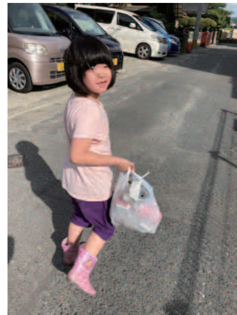
川沿いのゴミ拾いがんばったよ!!