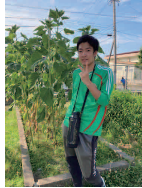
ひまわりと背くらべ