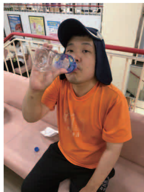
この帽子、熱中症予防には最適なんです