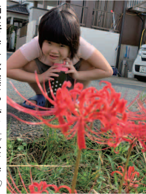
彼岸花に秋を感じますねえ