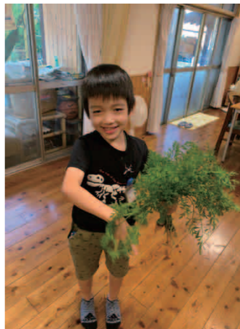
プランターの小さな人参収穫したよ♪