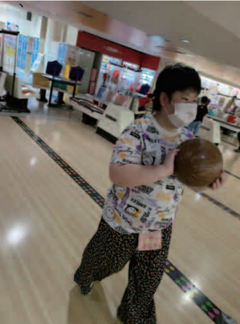
ガラガラのボーリング場でとても お得にプレイできてラッキー♪

引き続き、感染対策も行い、居室や移動支援にあたっております。 常にエスタスカーサはご利用様に寄り添い、笑顔を引き出す為、最善を尽くします。