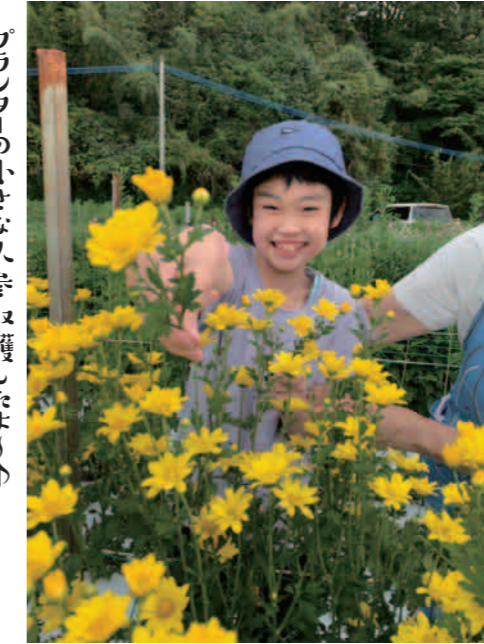
菊の花をたくさんいただきありがとうございます♡