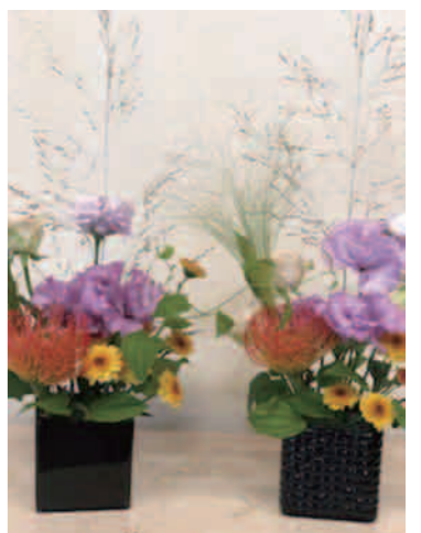
—昨年9月のアレンジです

今回のアレンジ教室は、密にならないよう屋外(テラス)での寄せ植えを考えていましたが花材がまだ揃わないとの事で、寄せ植えは11月に行います。よって10月は、9月に引き続き、心が癒されるようなアレンジを行なう予定です。