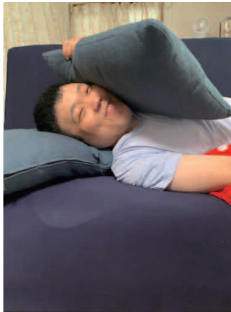
お気に入りのソファで くつろぎのひととき♡