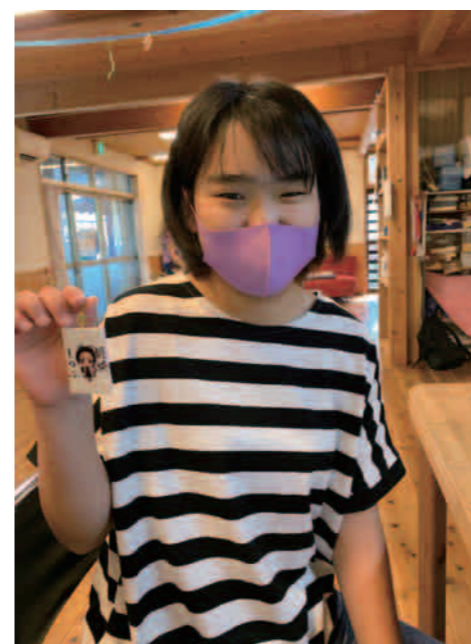
レジン大好き♡楽しいよ♪