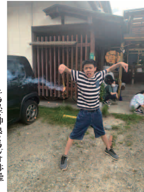
屋間の花火も楽しいぜ♡

緊急事態宣言下でも エスタスカーサに通所している 子どもたちは自然とたわむれたり 自分の好きな事に熱中したりして 相変わらず元気いっぱい 日々を過ごしています!!