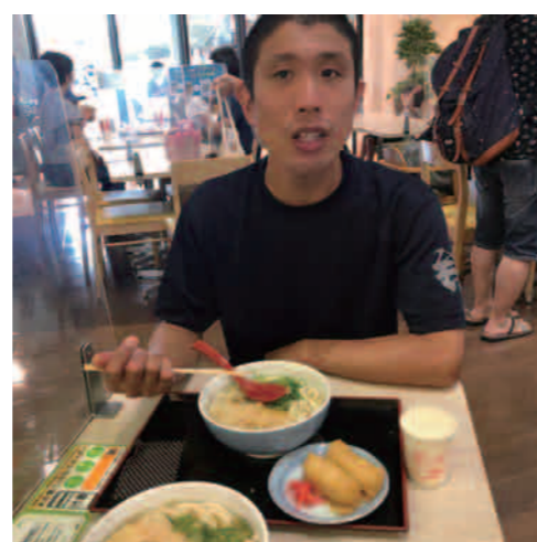
美味いうどん いただきま〜す♪