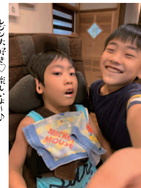
ぼくもマブダチだぜ!