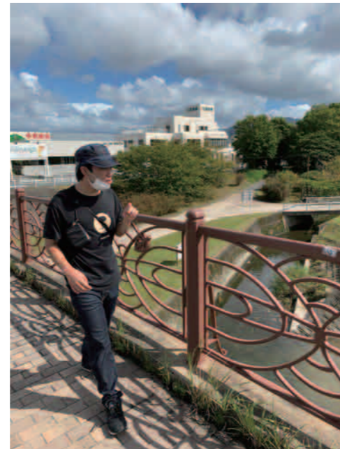
自然も満喫しながら ガンガン歩きます!!