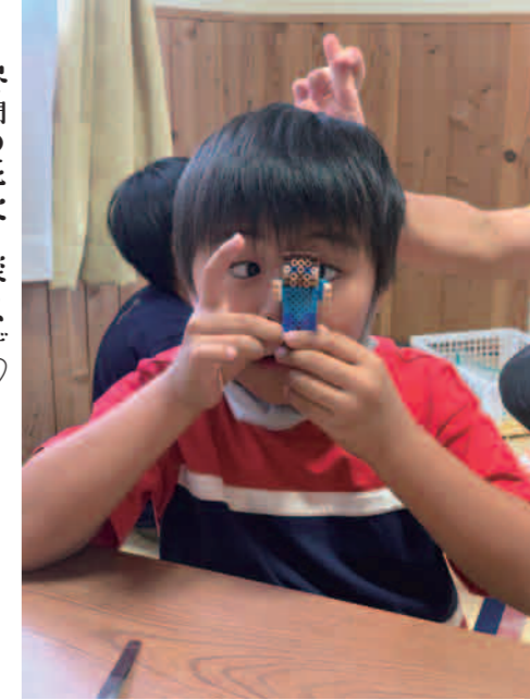
アイロンプールで作ったよ!