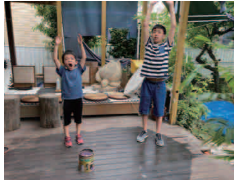
テラスで仲良くラジオ体操!