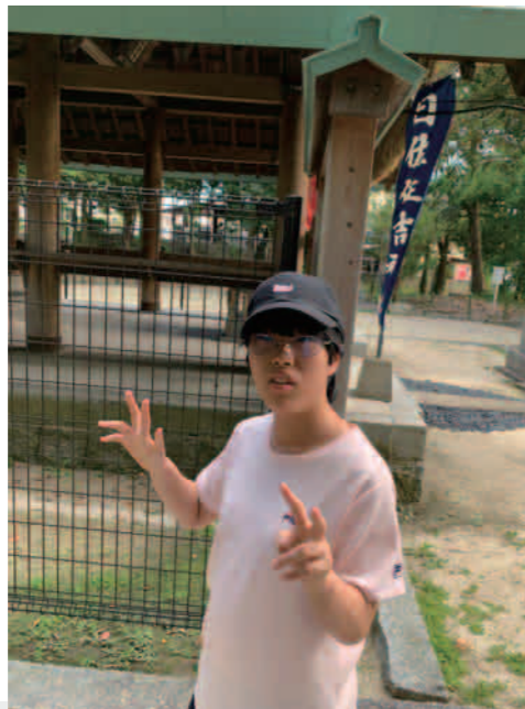
ウォーキングで腸の調子が整いますように☆