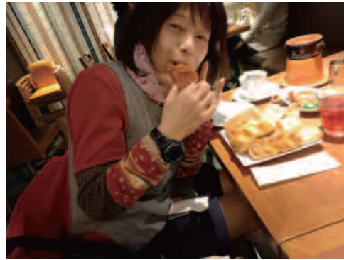
パン食べ放題～38個もいただきました!!