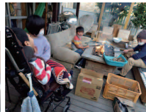
焚き火の季節がきた～!!!