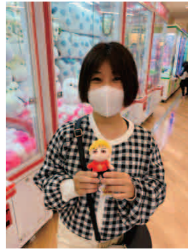
UFOキャッチャーでゲット～♡