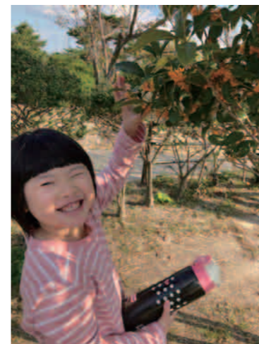
キンモクセイのいいかおり～♡