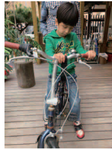
じてんしゃのりたい・・・でもコワイ