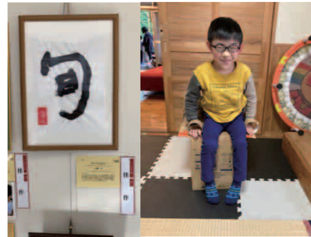
ボクの作品が賞を取ったよ!!!