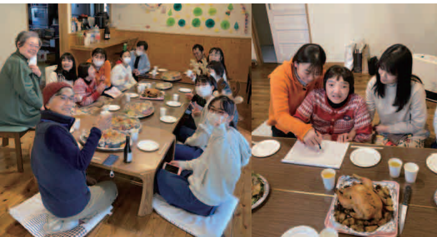
ありかネットワーククリスマスパーティー@エスタスカーサ