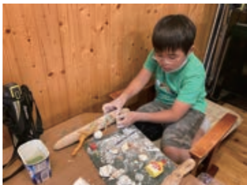
流木と粘土で芸術の秋も堪能しております

外で過ごしやすい季節になりました。 児童と一緒に畝をつくって種をまいたエスタス畑のお野菜たちも子どもたちの愛情をいっぱい受けて すくすくと育っています。 高等部の生徒たちは、花の花さんで職場体験実習をさせていただいたり して卒業後の心の準備も着々とすすんでいます。