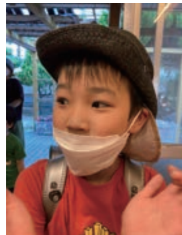
画伯は鼻にもアートもほどこしています