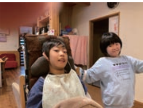
HAPPY BIRTHDAY TO YOU～♪