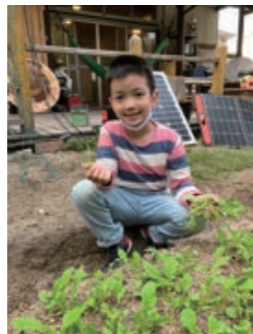
だいごんさんの間引きもしてまます