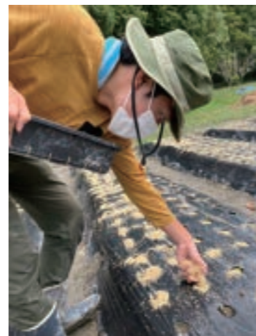
花の花さんのカフェや農園での職場体験実習にまじめに取り組んでいます!!!