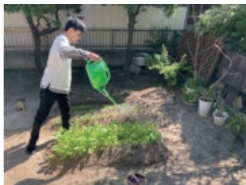
どんどん大きくなあれ～♪