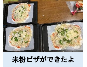
米粉ピザができたよ