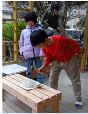
鏡餅を槌で割ります！