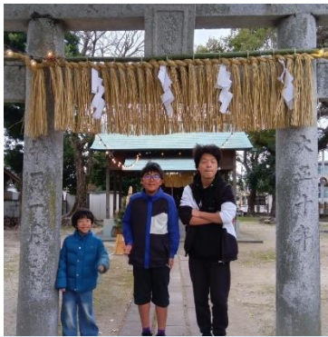
参拝を終えて笑顔で♪