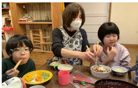
美味しいお食事を囲んで(ロコモコ丼)