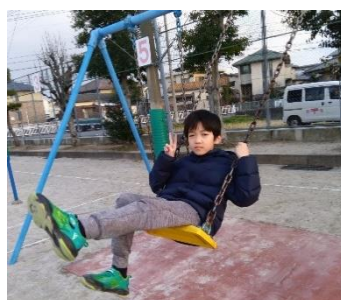
弥永西小でのお楽しみ♪