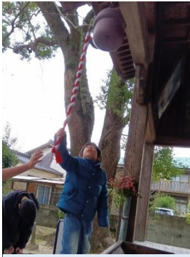
新年の鐘を鳴らして

2025年が始まりました！初詣、鏡開きをしました。良い一年を過ごすことができますように…。