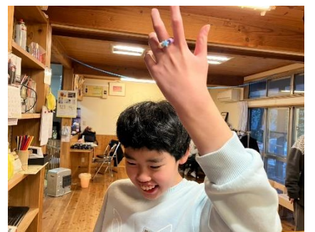
ビーズの指輪 完成しました！