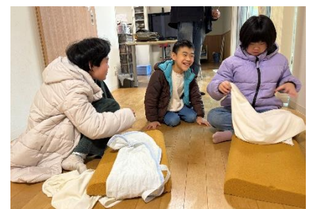
お手伝い 頑張ってるま～す！

子ども達は自分で好きな遊び好きな場所を見つけて友達との関係性を深めながら育ちを見せてくれています。そんな中で、自分でできることも増え、新たな自信もついているようです。今年もこれからの成長がとても楽しみです。