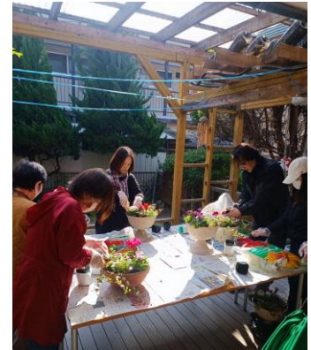
年末の寄せ植え教室より