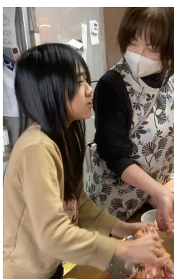
愛と気合を込めて